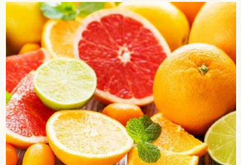
U.S. citrus volume was up and prices were down in 2022-23, a USDA report says.

precios al productor de naranjas frescas fueron más bajos que la temporada pasada, según el informe.