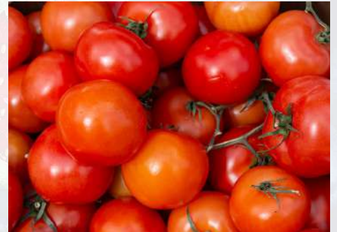
USDA statistics indicate a rise in the value of U.S. imports of Mexican tomatoes in 2023.

Las importaciones estadounidenses de tomates mexicanos a través de Otay Mesa, California, crecieron de $294 millones en 2020 a un máximo de $337 millones hasta noviembre de 2023,