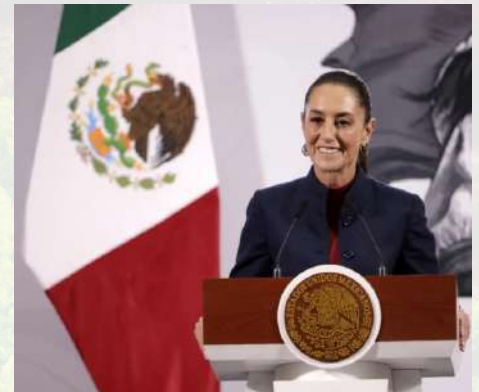
Claudia Sheinbaum Pardo, presidenta de México, durante una conferencia de prensa en el Palacio Nacional, el 17 de febrero de 2025, en la Ciudad de México, México.