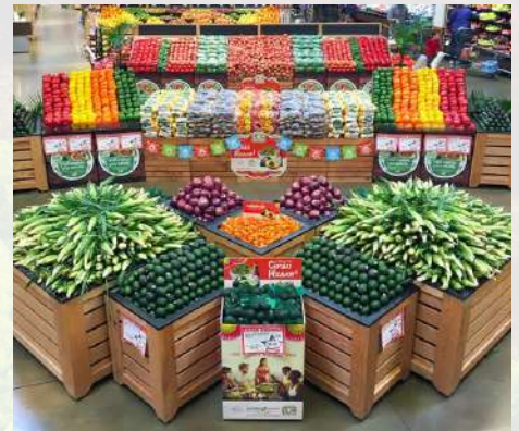
Los minoristas pueden usar exhibiciones creativas de productos esenciales para el Cinco de Mayo para atraer a los compradores que planean las festividades. La venta cruzada de productos y las promociones temáticas también pueden impulsar las ventas relacionadas.