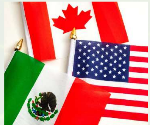
Banderas de Canadá, México y Estados Unidos

"Apoyamos exigir responsabilidades a los socios comerciales. Países que serían mercados ideales para las manzanas estadounidenses nos excluyeron debido a barreras comerciales no arancelarias", declaró Bair. Por eso, USApple apoyó firmemente el Acuerdo Estados Unidos-México-Canadá, que está funcionando bien, y esos países siguen siendo nuestros principales destinos de exportación.