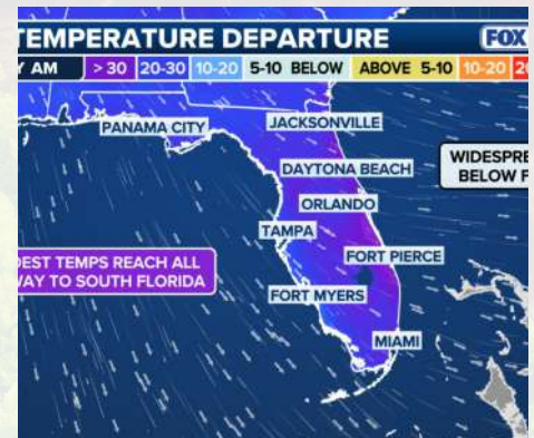
Este gráfico muestra las posibles bajas temperaturas generalizadas en Florida.

La probabilidad de una mezcla de lluvia y nieve el sábado por la noche es baja, y la